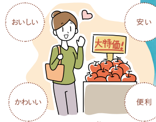
日常のお買い物に「新しい視点」をプラス！

安く、便利な商品をもっとたくさん使いたい……。でもその商品を作るために、魚の乱獲や森林の伐採、開発途上国での劣悪な労働環境など、さまざまな問題が引き起こされている場合があります。商品が私たちに届くまでには長い道のりがあり、手にした商品がどのように作られたのか、私たちに分かりにくいことが多いからです。だからこそ、毎日のお買い物でできることがあります。いつもの「商品の選び方」に、「どこで、誰が作っているか」「どのようにつくか」といった視点をプラスして